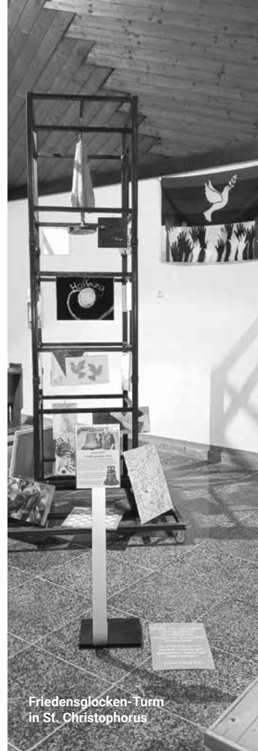
Friedensglocken-Turm in St. Christophorus